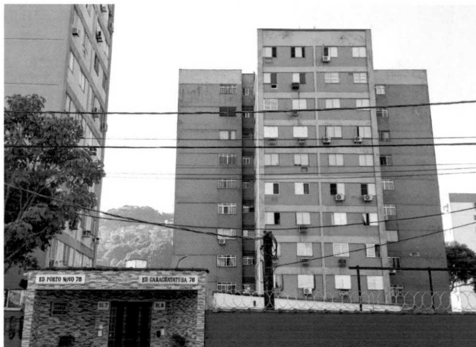
FACHADA DO PRÉDIO