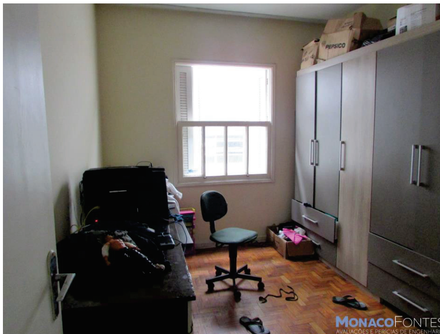
Acima e abaixo, tem-se o dormitório., onde notam-se suas dimensões e acabamentos.

O dormitório apresenta piso em tacos de madeira, paredes revestidas com massa fina pintada, teto revestido com massa fina pintada, porta de madeira e janela de madeira e vidro.