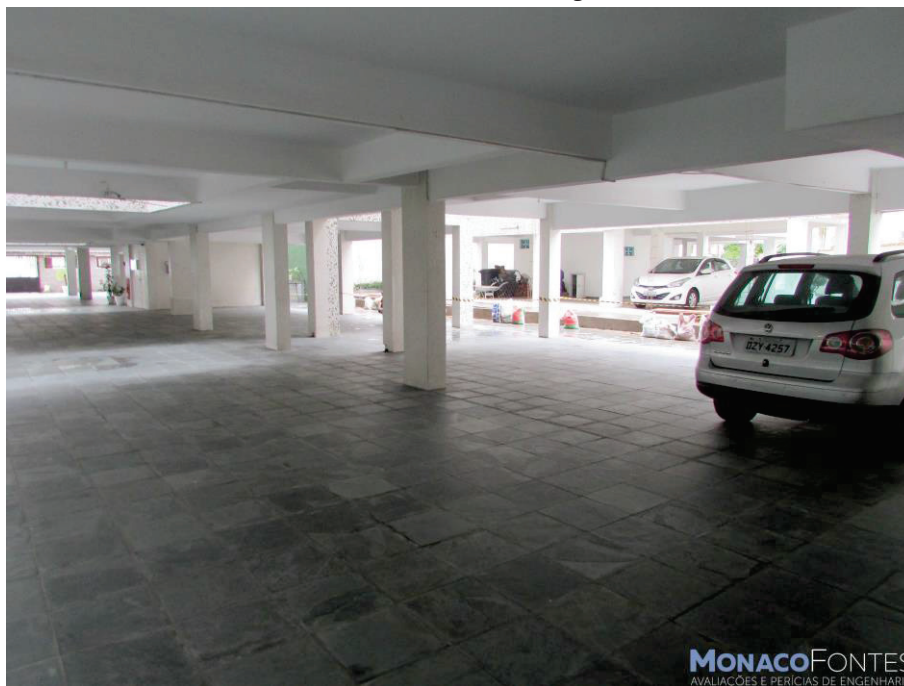
Acima e abaixo, tem-se a garagem, onde notam-se suas características e acabamentos.