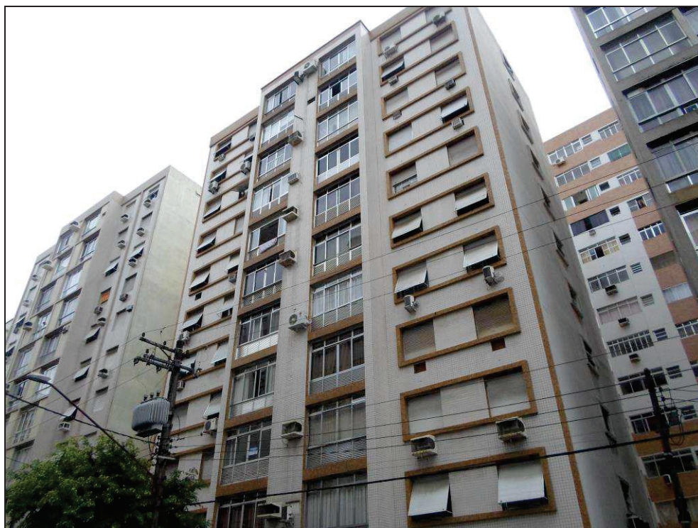
Acima, temos uma tomada da testada do Edifício Jandaia.

As imagens a seguir demonstram o “Condomínio Edifício Jandaia”, onde encontra-se inserida a referida unidade habitacional.