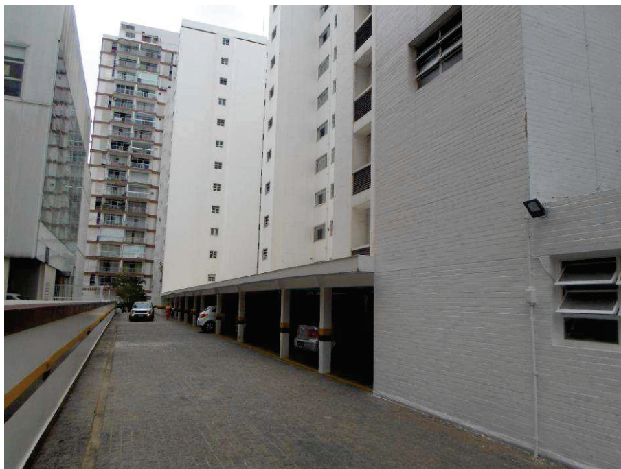
Acima e abaixo, tem-se ilustrada a área externa, onde observa-se suas características.