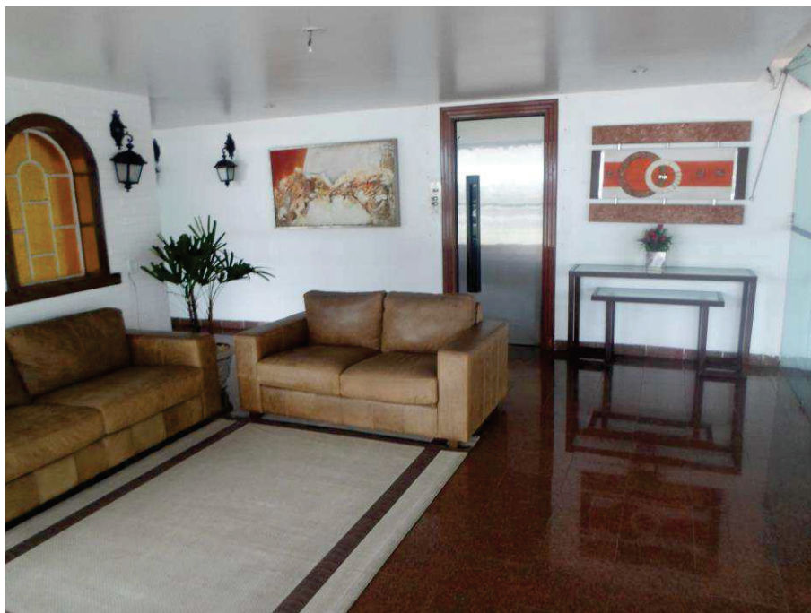
Acima e abaixo, tem-se ilustrado o Hall de Entrada do edifício, onde observa-se suas características.