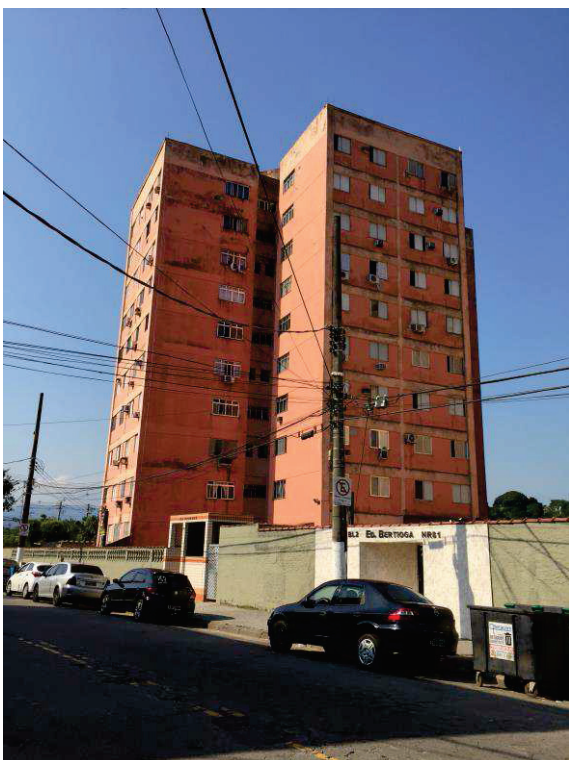
Figura 4: Vista geral do prédio