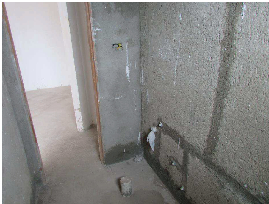
Acima e abaixo, tem-se o banheiro, onde observa-se suas dimensões e acabamentos.