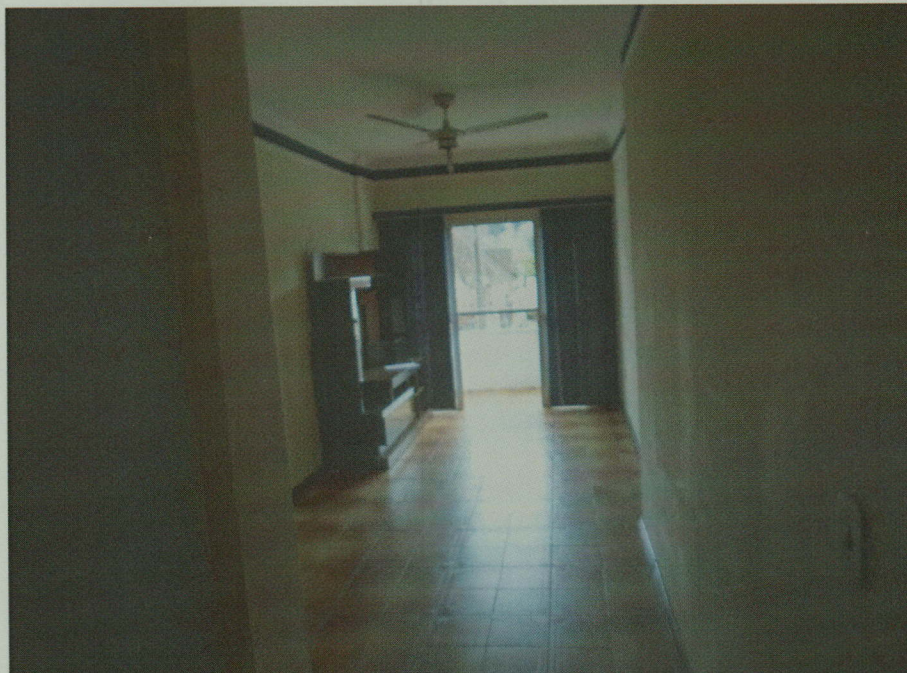
Acima e abaixo, tem-se a Sala de Estar, onde nota-se suas dimensões e características.

A Sala de Estar possui piso e rodapés cerâmicos, paredes revestidas com massa fina pintada, teto revestido com gesso e porta de madeira.