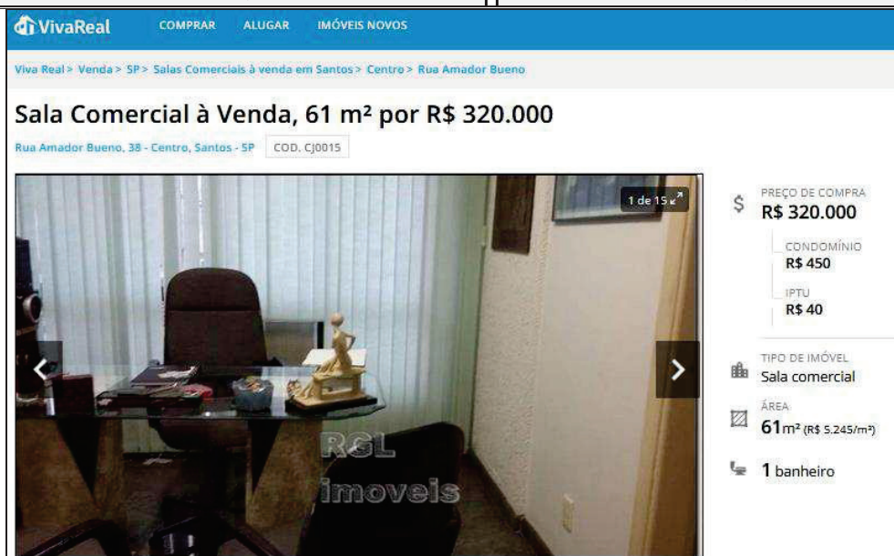
Na imagem acima, observa-se o anúncio referente a oferta do Elemento Comparativo 01.