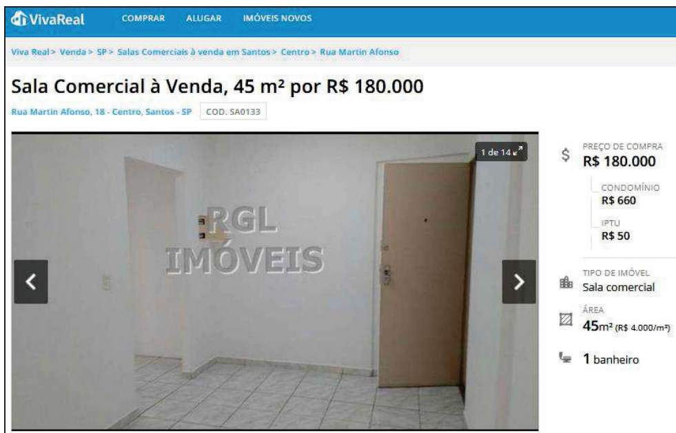
Na imagem acima, nota-se o anúncio referente a oferta do Elemento Comparativo 03.