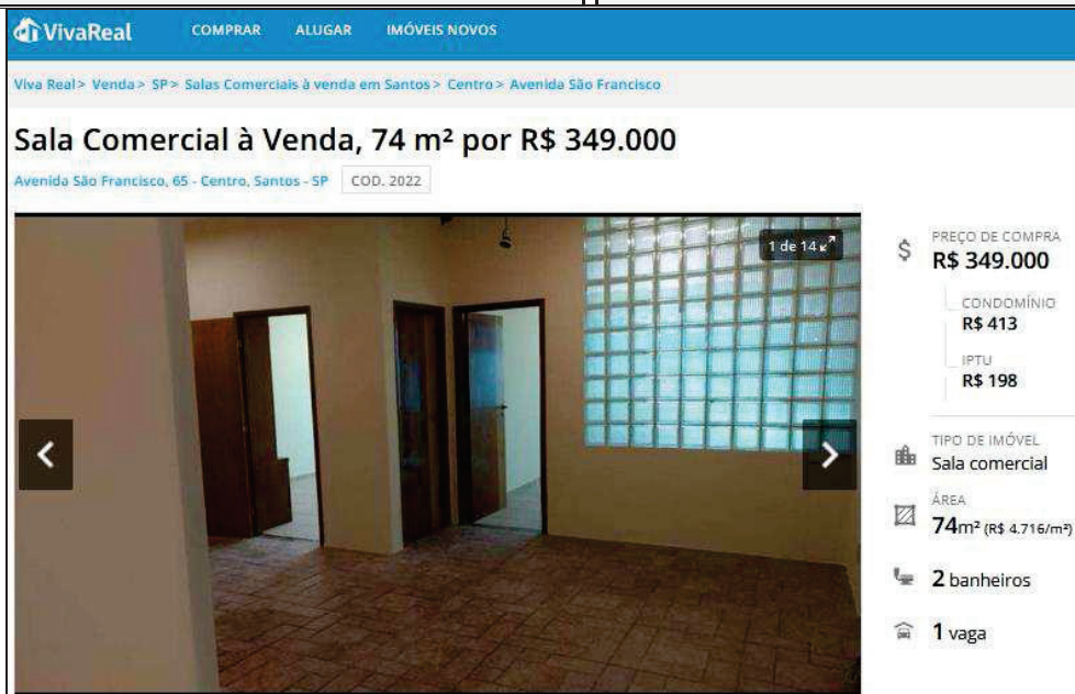
Na imagem acima, nota-se o anúncio referente a oferta do Elemento Comparativo 02.