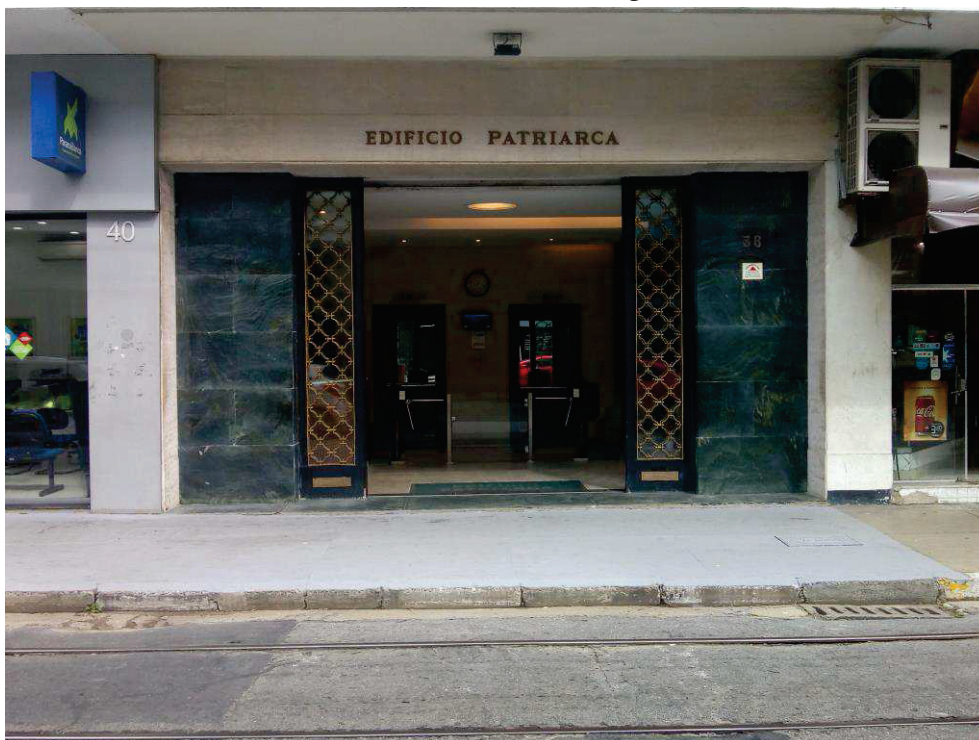
Acima e abaixo, tem-se outra tomada da testada do edifício, onde é possível observar a entrada de acesso à pedestres.