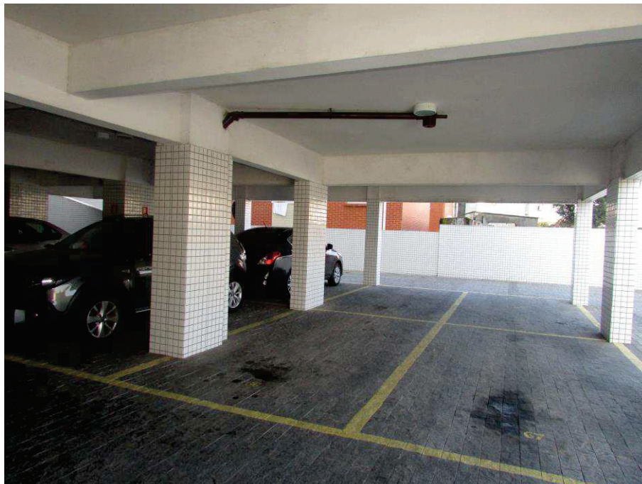
Acima e abaixo, tem-se ilustrado o estacionamento, onde observa-se suas características.

O Estacionamento apresenta piso em pedra e demarcação das vagas pintadas, muros e pilares revestidos com azulejos.